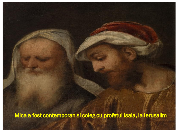
Mica a fost contemporan și coleg cu profetul Isaia, la Ierusalim